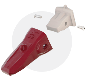
TWINMET 1 pour pelles de 250 à 400 t

Le système de dents à 2 éléments est spécifiquement conçu pour les lames moulées TERRA plus petites de 116" et 136" qui fonctionnent en terrains à niveau moyen d'abrasion et d'impact.