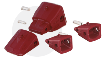
TWINMET Retrofit pour une première expérience

Le système original composé de 3 éléments dans les tailles 5 et 7 est conçu pour les lames moulées TERRA et assure une performance et une fiabilité maximales en terrains fortement abrasifs et à forts impacts.